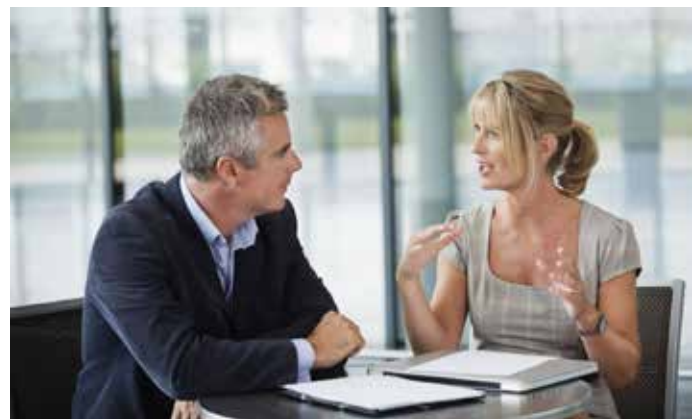
Der Austausch mit erfahrenen Experten kann auf dem Weg in die Selbstständigkeit hilfreich sein.

Das rund einstündige, kostenfreie und neutrale Gespräch findet in den KUS-Geschäftsräumen, Spitalstraße 7 in Pfaffenhofen statt. Die Vereinbarung eines kostenfreien Gesprächstermins ist bis Montag, 17. Juni , telefonisch unter 08441 40074-40 möglich. Ausführliche Informationen zu den vielseitigen Angeboten sind unter www.kus-pfaffenhofen.de/gruendung abrufbar.